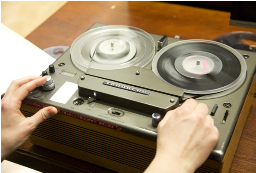
Teosta varten kuunneltiin läpi koko yli 100-tuntinen nauhoitemateriaali. Niille tallentuneiden tarinoiden lisäksi nauhat itse ovat osa menneisyyttä ja kulttuurihistoriaa.